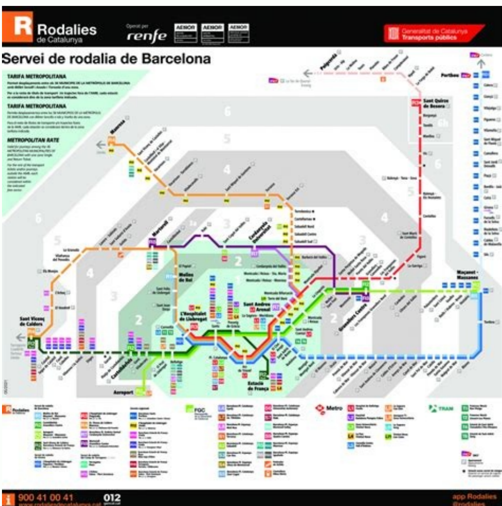
Mapa líneas rodalies renfe barcelona. Mapa zonas rodalies renfe barcelona. Mapa de zonas renfe rodalies barcelona. Mapa de rodalies renfe barcelona. Mapa rodalies renfe barcelona pdf.